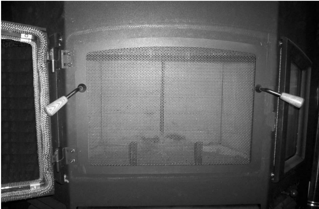
Figure 2 Pare-Étincelles sur le foyer / Firescreen on the fireplace