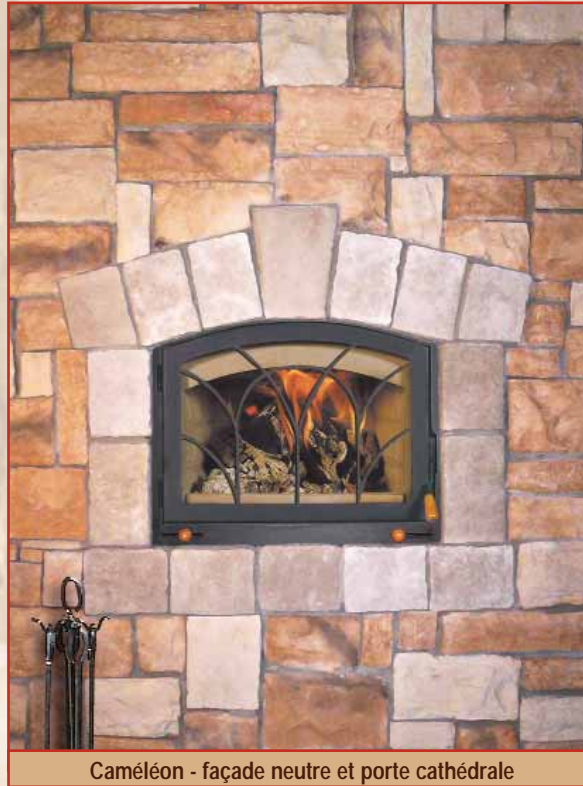
Caméléon - façade neutre et porte cathédrale

Le Caméléon est le seul foyer encastré qui vous permet de couvrir de maçonnerie ses façade. La conception de la "façade neutre" allie la performance du haut rendement approuvé par les normes EPA avec l'apparence d'un foyer de maçonnerie traditionnel.