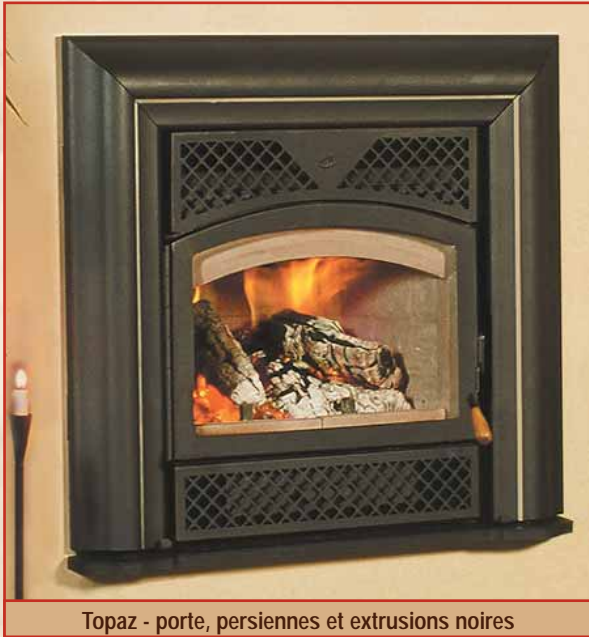
Topaz - porte, persiennes et extrusions noires

Le design unique du Topaz permet d'éliminer complètement les matériaux non combustibles de la façade, ce qui en fait l'un des foyers à la finition la plus facile et des plus versatile sur le marché.